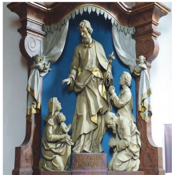
Pauluskirche Worms

Jeden von uns aber nimm unter deinen beständigen Schutz, damit wir nach deinem Beispiel und mit deiner Hilfe heilig leben, gut sterben und die ewige Glückseligkeit im Himmel erlangen. Amen.